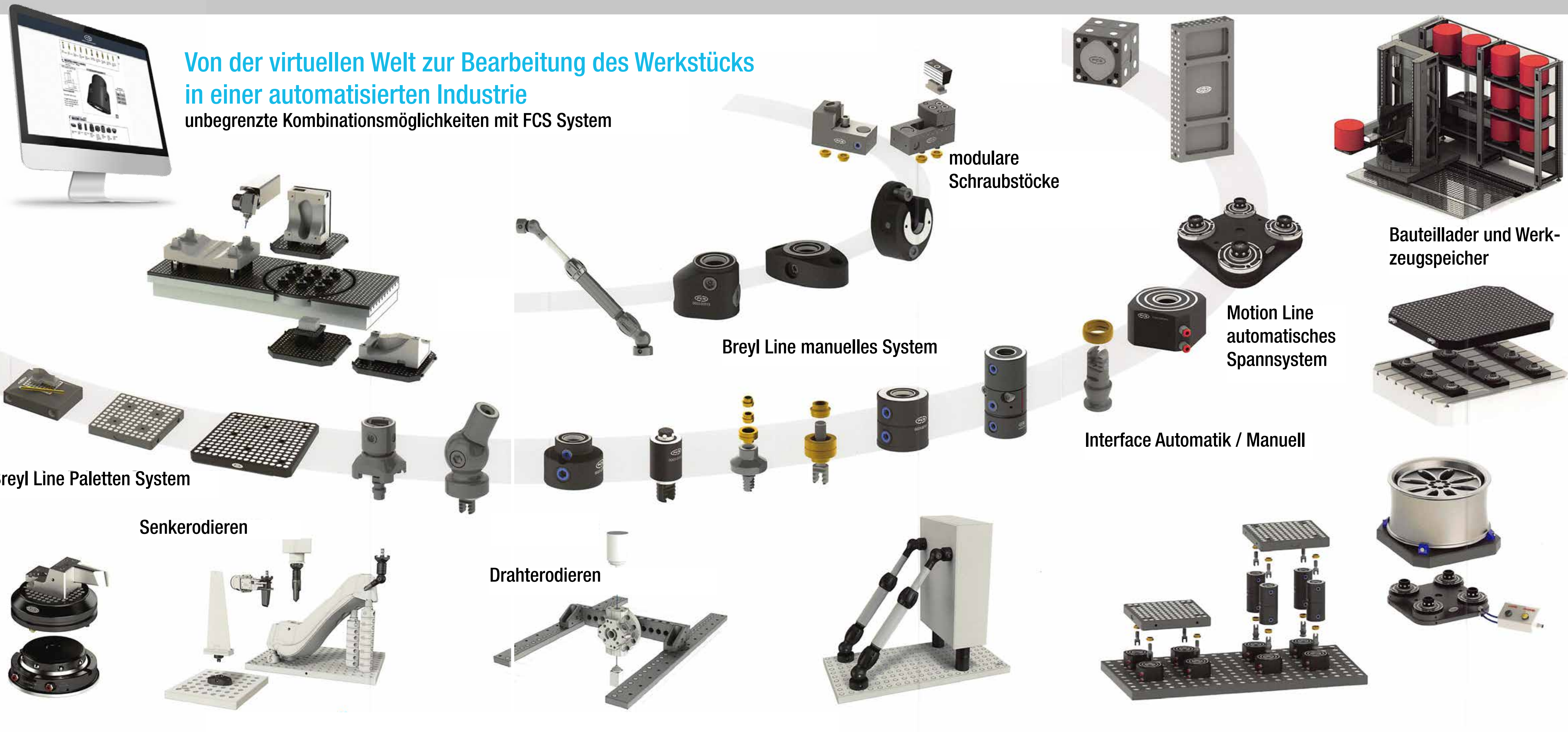
Breyll Line Paletten System